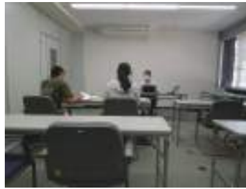
講師 八幡浜税務署担当官