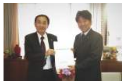
八幡浜市 大城市長

法人会の提言活動は法人税の引き下げなどをはじめ、同族会社の留保金課税制度の抜本的な見直し、事業承継に関する税制の創設など中小企業の活性化に資する税制の構築に寄与しています。