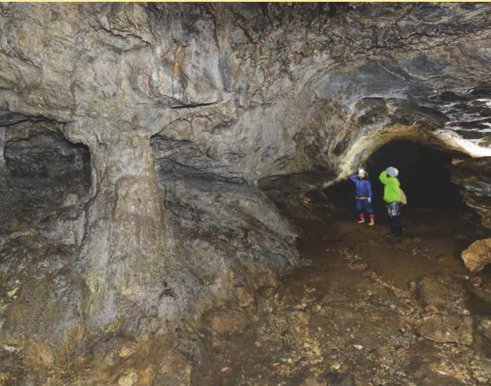
「羅漢穴」西予市野村町小松