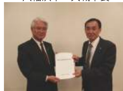
八幡浜市議会 新宮議長